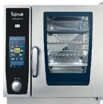
コンビオープン (スチコン)