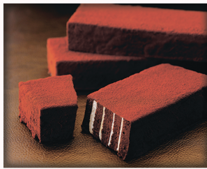
【モンシェリー松下】 チョコレンガ