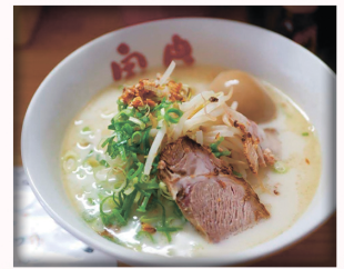
【鹿児島ラーメン宝島】 ラーメン