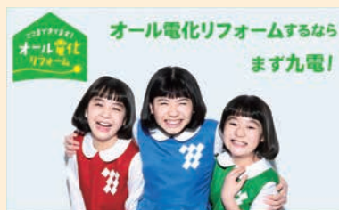
オール電化リフォームのテレビCM

お客様から信頼され選ばれ続けるために、これからもお客様の声をもとにサービスの拡充に取り組みます。