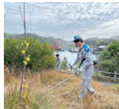
西海国立公園内長尾半島除草(佐世保市)