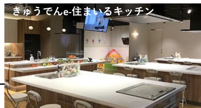
きゅうでんe-住まいるキッチン

第1回・第3回・第4回は九州電力北九州支店集合・解散、第2回は小倉駅集合・解散です。 第3回は会場収容人数の都合上、会員の皆さまを3日間のうちいずれかの日程に振り分けてご参加いただきますので、ご了承ください。 ※イベントの内容と時間は都合により変更となる場合がございます。