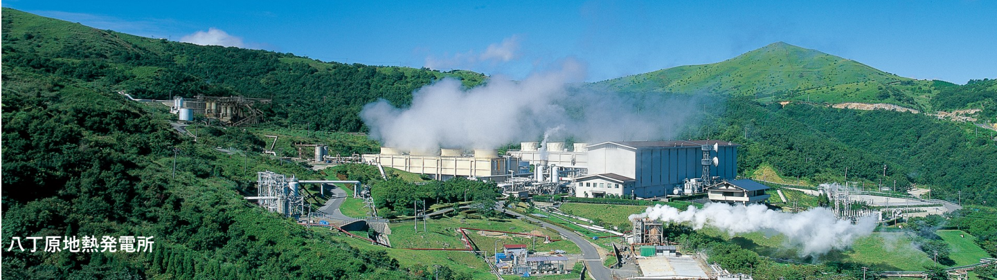
八丁原地熱発電所