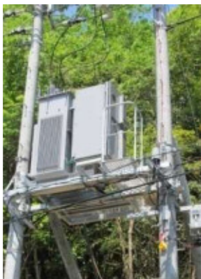
九州電力殿の配電系統にて実証中