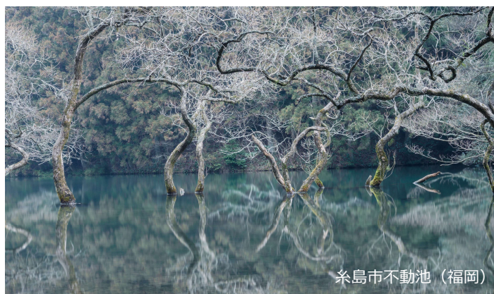
糸島市不動池（福岡）