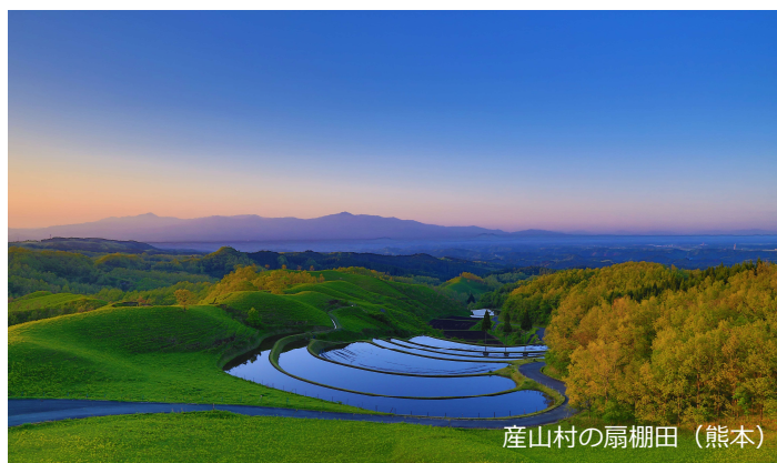
産山村の扇棚田（熊本）